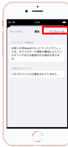
⑩ 【インストール】を選択