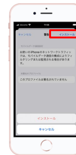
⑪ 【インストール】を選択