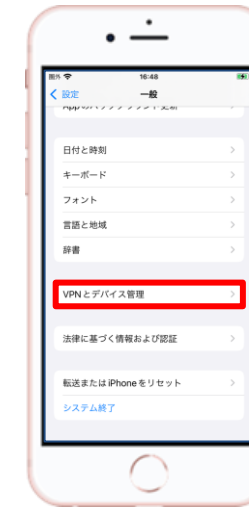
⑦ 【VPNとデバイス管理】を選択