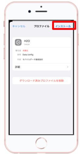
⑧ 【インストール】を選択