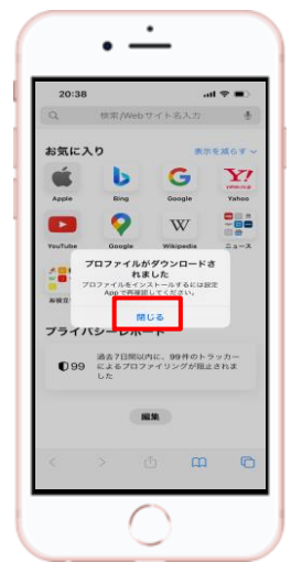
④ 【閉じる】を選択、ホーム画面に戻る